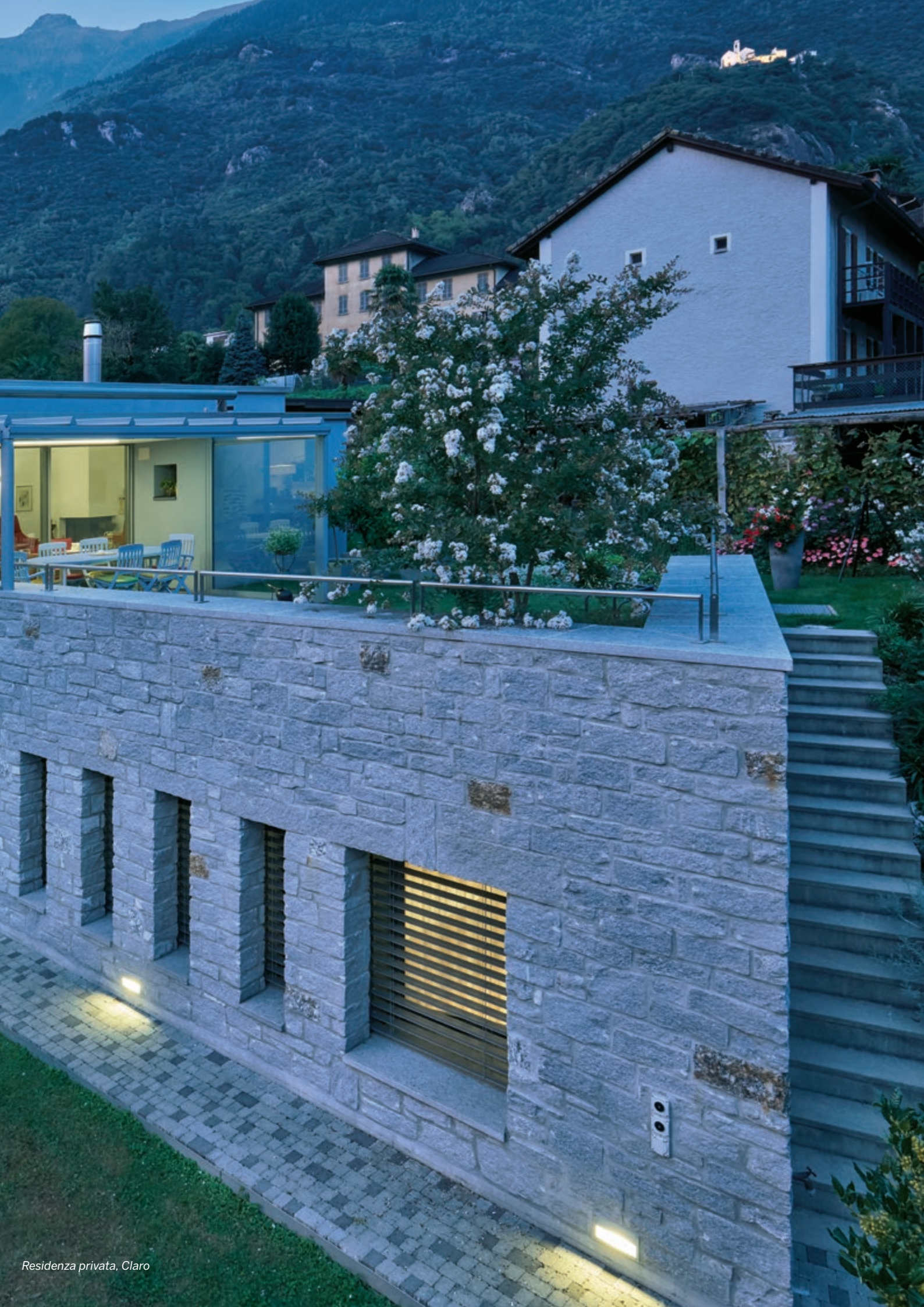
Residenza privata, Claro